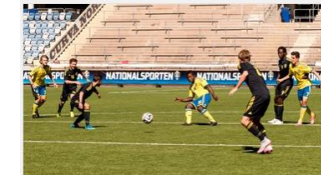
Träningspass och övningar 11 vs 11

Med inlogg till Fotbollsportalen där SvFF Spelarutbildningsplan finns kommer ni åt en övningsbank och filmklipp Det finns färdiga träningspass, dela träningspass med fler ledare i laget inför en träning samt skapa egna övningar.